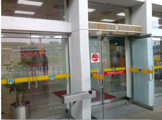
松山機場 14、15 號門