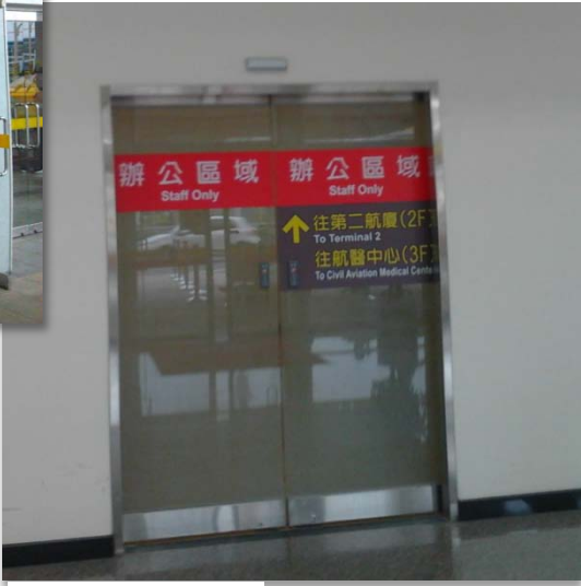
航醫中心電梯入口