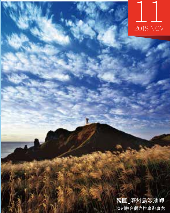
韓國_濟州島涉池岬 濟州駐台觀光推廣辦事處