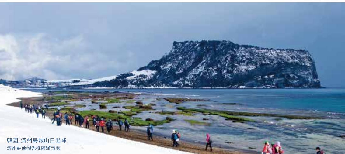
韓國_濟州島城山日出峰 濟州駐台觀光推廣辦事處