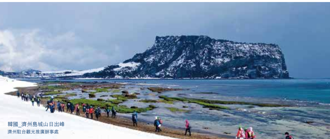
韓國_濟州島城山日出峰 濟州駐台觀光推廣辦事處